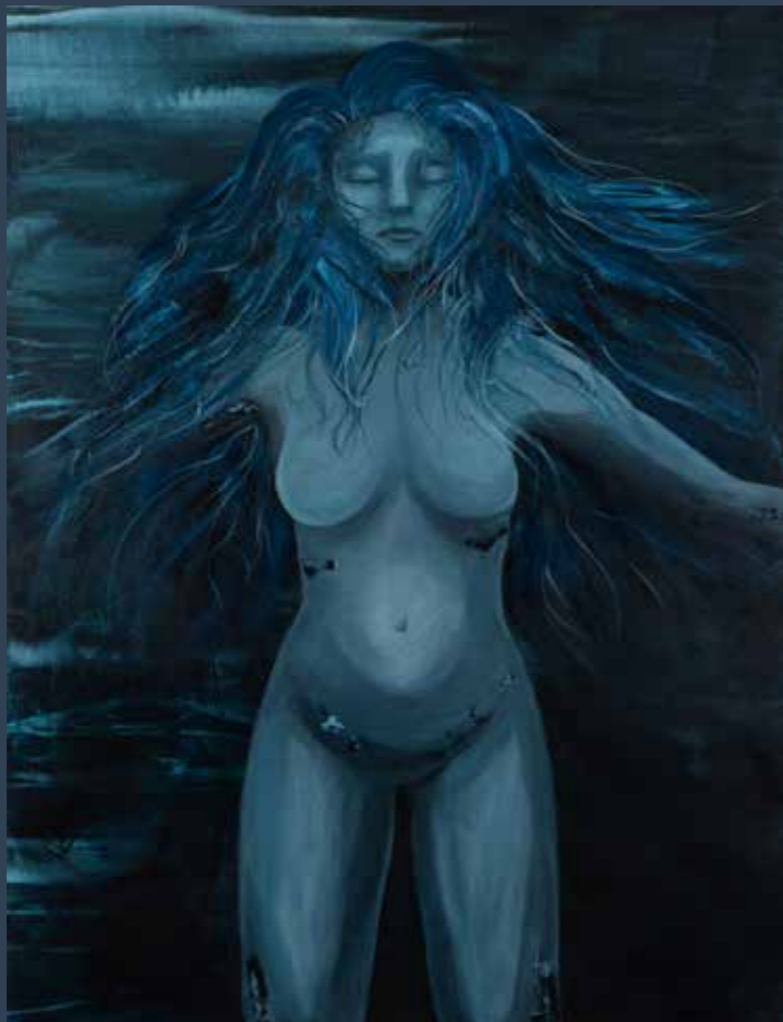
Luonnotar, 100x140, acrylics on canvas A painting by Aphrodite Patoulidou

Daughter of Air and Mother of Waters, Ilmatar - otherwise known as Luonnotar. This painting shows the goddess of the Finnish epic poem of Kalevala during the 700 years she is aimlessly drifting the open oceans, regretting to have left the heavens, pregnant by the sea but unable to give birth. This painting was inspired by the homonymous tone poem composed by Jean Sibelius. The five colours used are: Payne's Grey, Prussian Blue, Peacock Blue, Pearl Blue and Titanium White. - November 2023